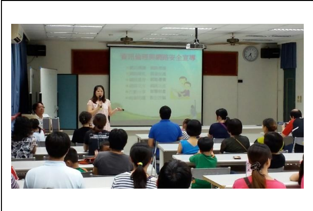
104 學年班親會家長資訊倫理宣導簽到表