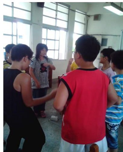
說明：跟著節拍玩「你、我、他」的遊戲。