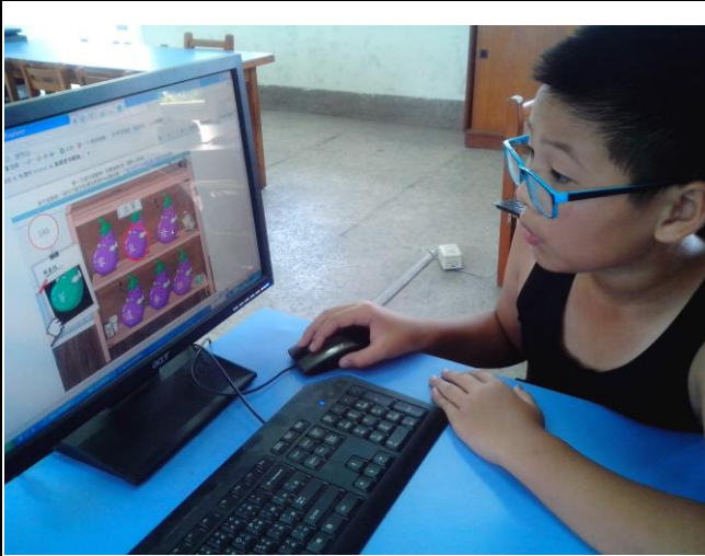
說明：均一教育平台語詞遊戲，激發學習動機。