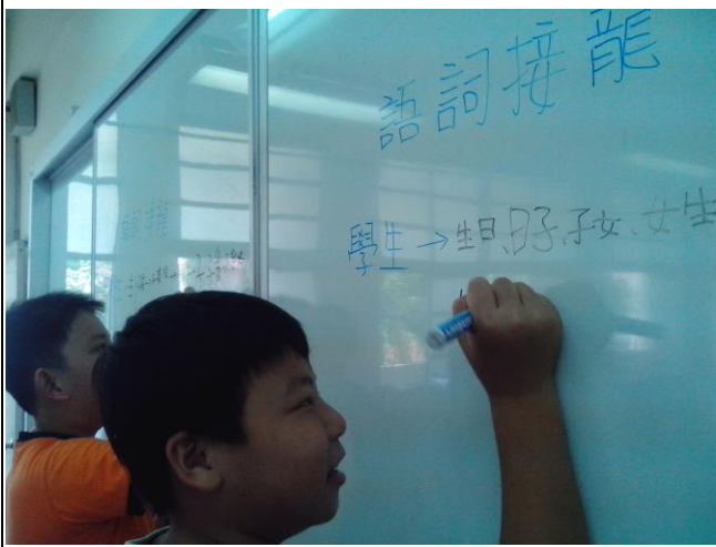
說明：分組比賽－語詞接龍。