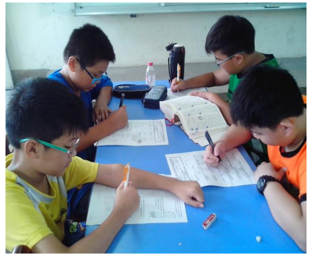
說明：同學先自己練習，等一下再分組討論。