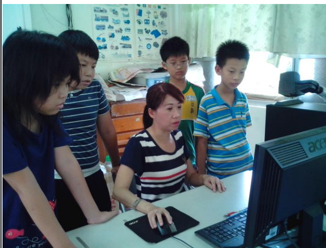
說明：老師利用電腦教學，激發學生的學習興趣。