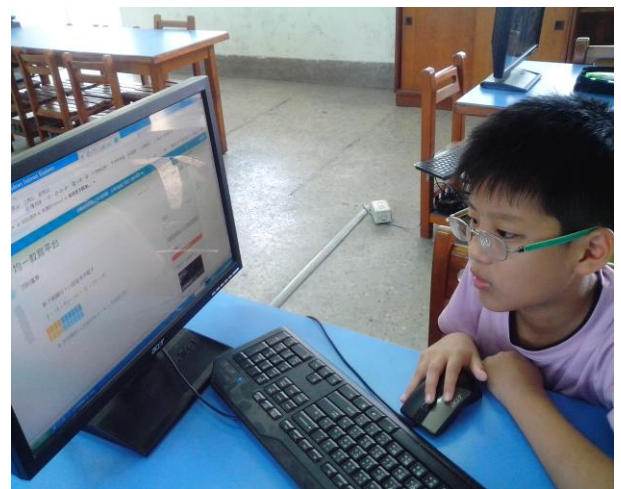
說明：從電腦遊戲學數學，學生認真思考的神情。