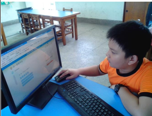
說明：均一教育平台數學線上練習。