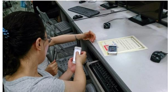
說明：學員互相討論雲端功能使用方法