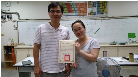
說明：講師頒發證書給完成研習的學員