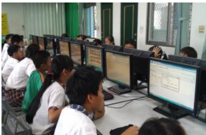
▲學生進行 movie maker 影片編輯