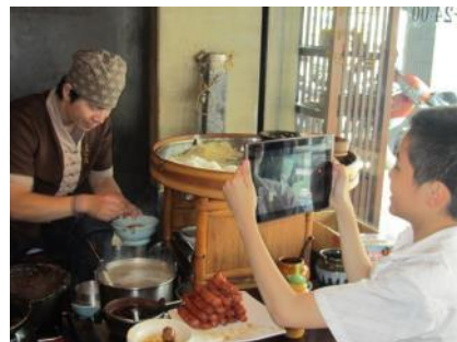
▲學生使用平板電腦拍攝訪談過程