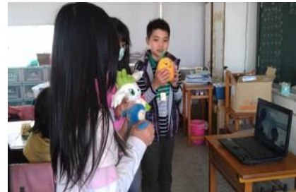
▲學生介紹自己心愛的物品與日本 學生交流