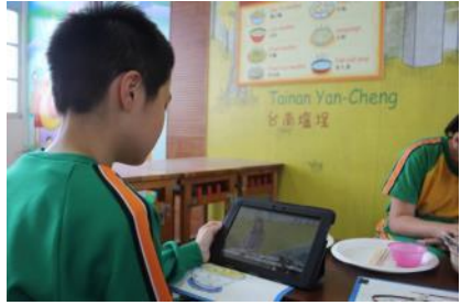
▲學生利用平板電腦進行網站學習