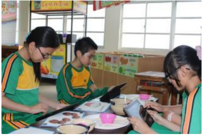
▲學生利用平板電腦進行網站學習