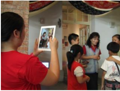
▲學生使用平板電腦拍攝訪問過程