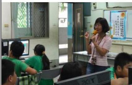
▲教師進行 X-mind 軟體教學