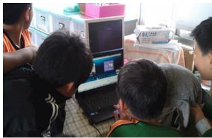
▲學生透過即時通訊軟體與日本學校 進行交流