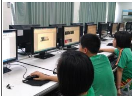
▲學生上網搜尋府城特色資料