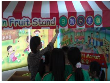
▲教師講解 QR-Code 掃描之訣竅