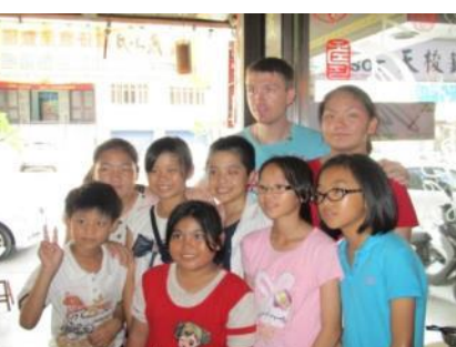
▲學生訪問來自瑞典的客人後合照