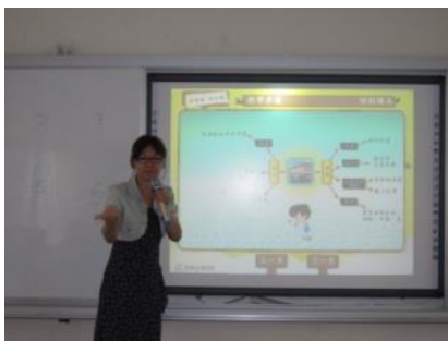
▲教師請學生針對課文發表心智圖