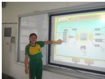
▲學生上台分享看法