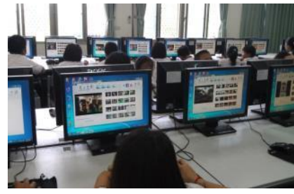
▲進行 movie maker 影片編輯教學