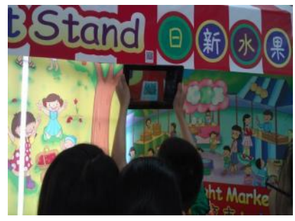
▲學生實地操作 QR-Code 掃描