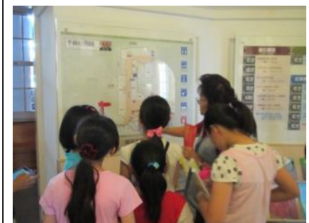
▲學生以 EverNote 錄製解說