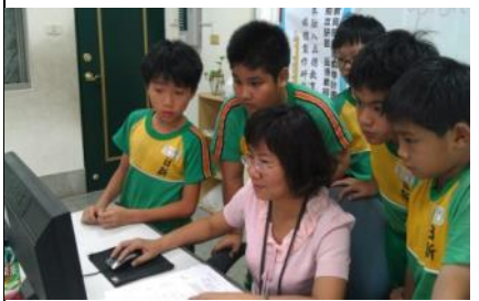
▲教師分組進行 X-mind 作業指導