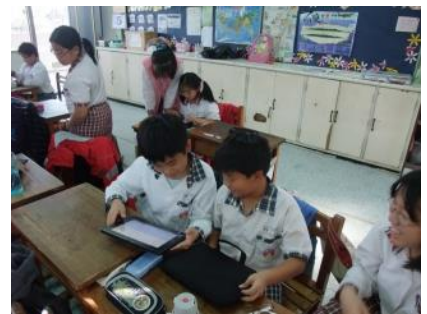
▲學生認真學習平板腦的使用操作