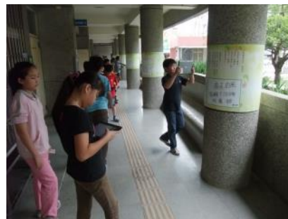
▲學生分組進行采風詩道學習