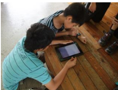
▲學生進行新詩討論活動