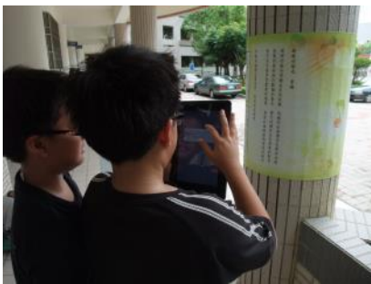
▲學生拍攝采風詩道上的新詩