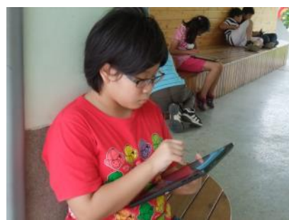
▲學生進行討論內容記錄