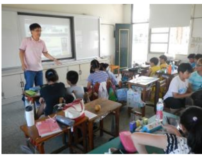
▲教師指導學生使用平板電腦