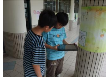
▲學生在采風詩道進行討論