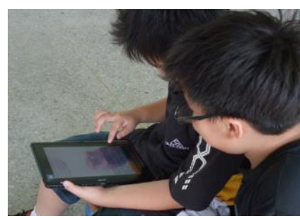
▲學生邊討論邊紀錄