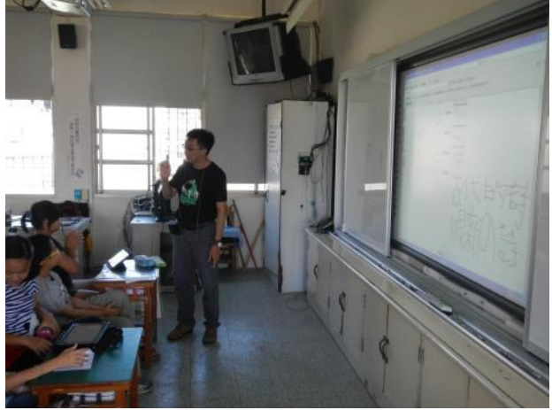
▲教師於班級進行各組討論內容之發表與檢討