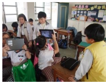
▲學生練習平板電腦的照相功能