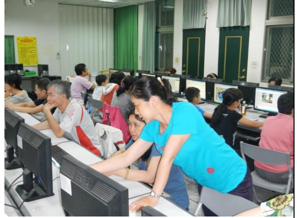
說明：助教協助學員解決電腦操作問題講