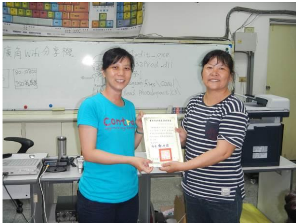
說明：頒發結業證書給學員。