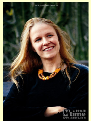
墨水世界作者-柯奈莉亞·馮克