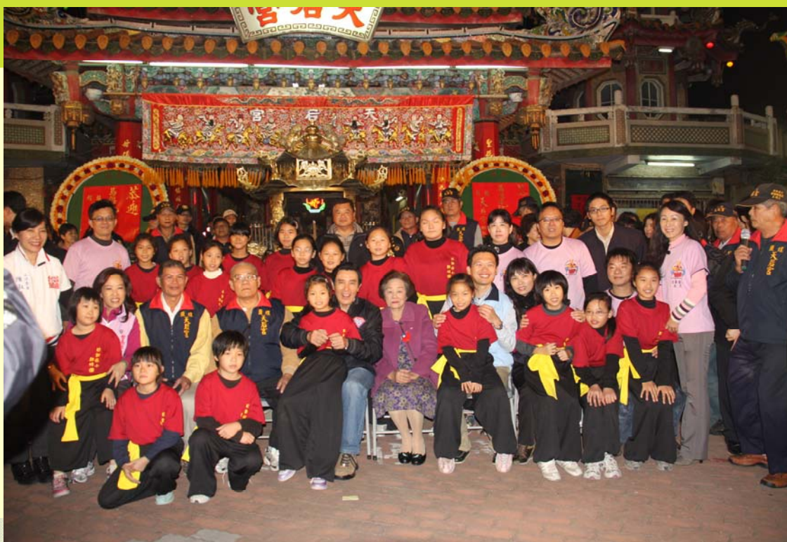
本校鼓技團至天后宮演出後與馬總統合影留念